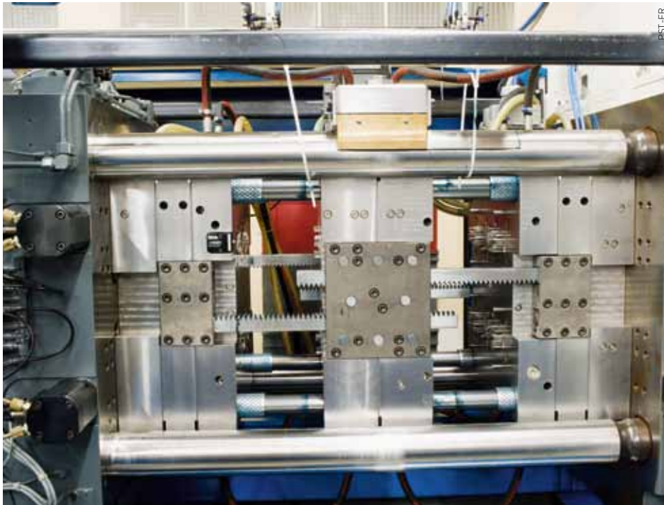
70'840 tonnes de matière plastique ont contribué à l'essor de la plasturgie, rien que dans le canton de Fribourg.

Soutenu par le canton de Fribourg et la Confédération via la Nouvelle Politique Régionale (NPR), le Pôle scientifique et technologique fribourgeois (PST-FR) tisse depuis quelques années une toile de clusters thématiques qui offre aux entreprises une structure idéale pour asseoir leur compétitivité. Le but : développer et transférer connaissances et savoirs à l'extérieur du canton de Fribourg. La plasturgie, l'un des cinq piliers de ce pentagone scientifique et technologique, en témoigne.